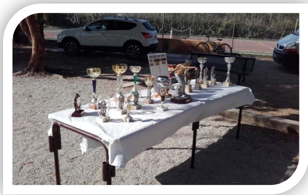
Les trophées de la Sophie Bélarganaise