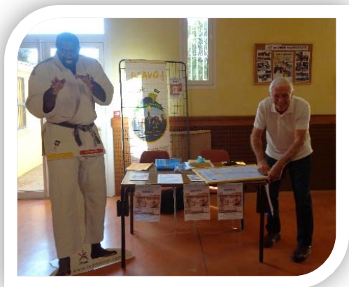
Le Judo-Club et Teddy Riner en taille réelle !