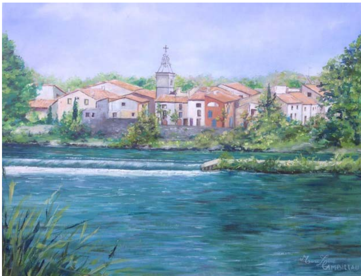
Tableau réalisé lors de la Journée des Associations par Madame CAMBILLAU